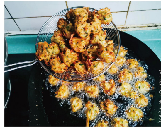
富瑞康天然气