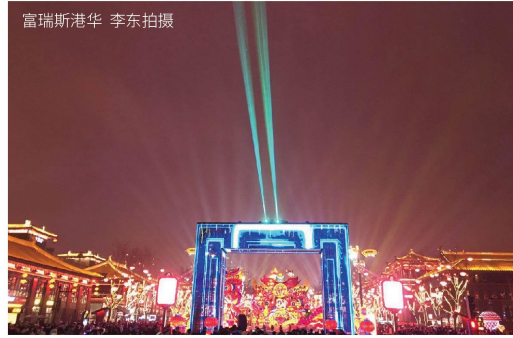
富瑞斯港华