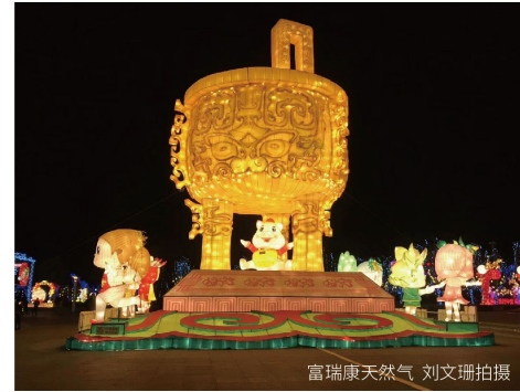
富瑞康天然气