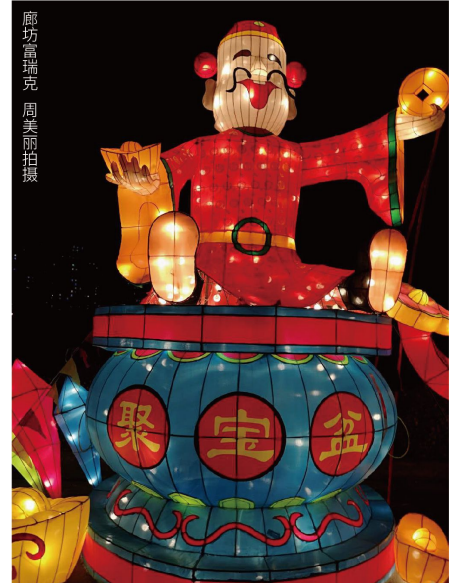
廊坊富瑞克 周美丽拍摄