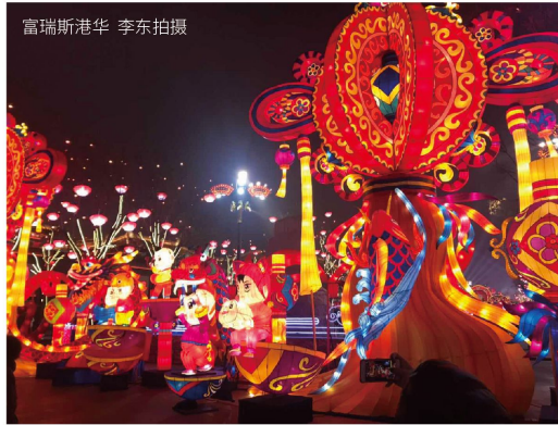
富瑞斯港华