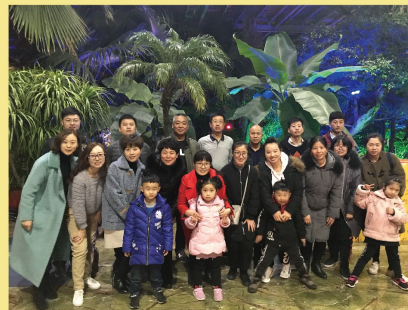
1月26日 隆焰燃气设备合聚共绘欢乐家宴席间欢声笑语不断，洋溢着愉快的家庭气氛。