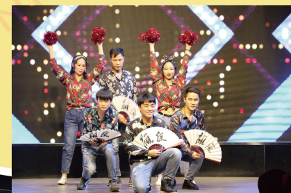
1月21日 富瑞康天然气年会绚烂的晚会灯光下，青春洋溢的歌舞与激动人心的抽奖相辅相成，为晚会增添添色。