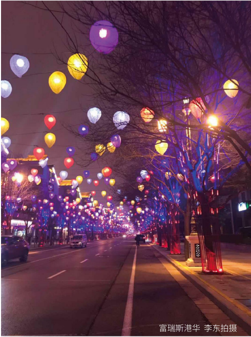
富瑞斯港华