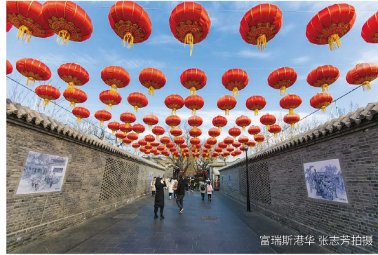
富瑞斯港华