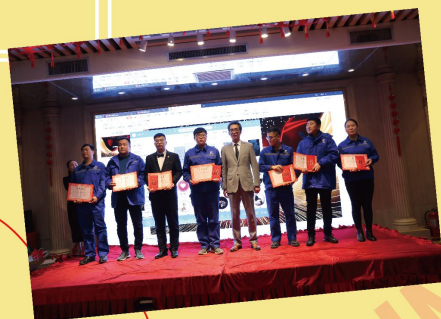
1月20日 富瑞康管道“聚变”主题年会精彩激烈的节目表演层出不穷，打鼓、相声、歌舞等多种形式的演绎精彩纷呈。